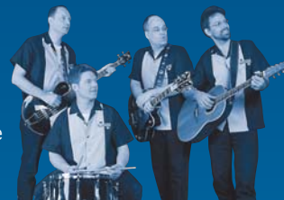
Bekannte regionale Bands sorgen für gute Stimmung.