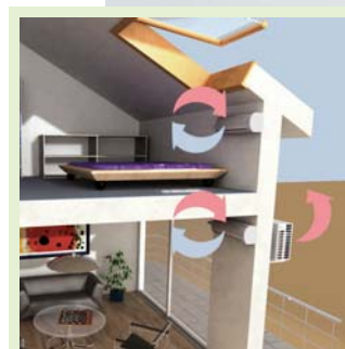
Kühlender Kreislauf: Die Innengeräte nehmen die warme Luft auf und geben sie über ein zentrales Außengerät an die Umgebung ab.