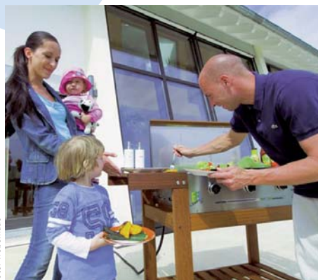
Mit Erdgas grillen Sie bequem – und das Grillgut wird schonend zubereitet.

Bevor Fleisch und Gemüse brutzeln, muss zunächst ein Grill her. Die Auswahl ist groß – so dass Sie bestimmt das richtige Gerät finden. Den Geruch eines Holzkohle-Grills möchten Nostalgiker nicht missen: Der Rauch verleiht dem Fleisch einen unverwechselbaren Geschmack. Erdgas- und strombetriebene Grills sind dafür recht bequem in der Handhabung. Zunächst sparen Sie sich die lästige Frage: Reicht die Kohle noch aus? Denn die Energie kommt komfortabel aus