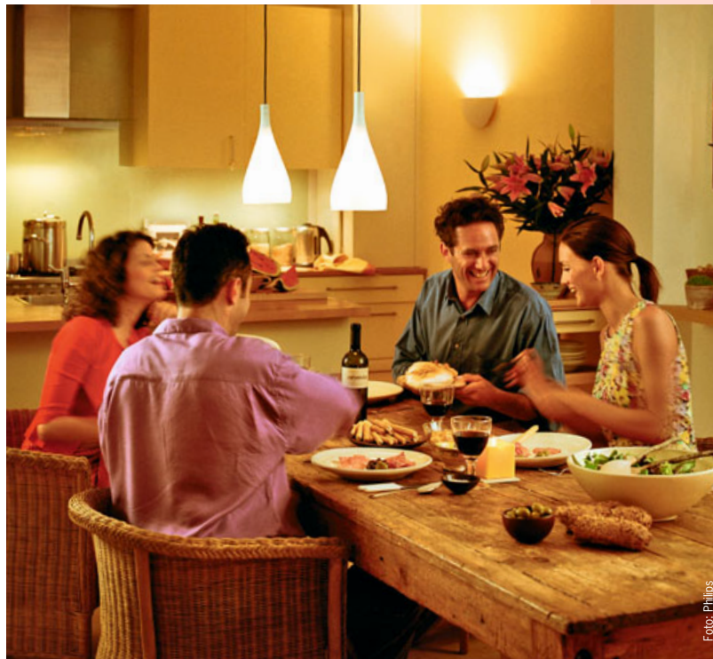
Gut ausgeleuchtet: Das passende Licht sorgt für eine Atmosphäre zum Wohlfühlen.

Beim Kochen oder Arbeiten mit scharfen Messern sorgt Licht für Sicherheit. Bei gut beleuchteten Arbeitsflächen stehen Sie sich selbst nicht „im Licht“. Besonders effizient sind unter den Oberschränken angebrachte Leuchten oder Wandleuchten, die nach unten strahlen. Für den Küchen- oder Esstisch ist eine höhenverstellbare Hängeleuchte mit warmem Licht genau richtig.