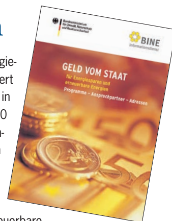
Konzept, Text und Gestaltung: pr/omotion GmbH

Die Broschüre „Geld vom Staat für Energiesparen und erneuerbare Energie“ kann auf der Internetseite des Bundesumweltministeriums heruntergeladen werden: www.bmu.de .