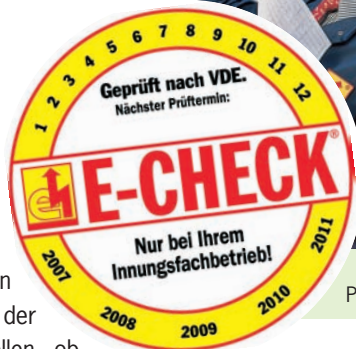
Nach dem E-Check gibt es die Prüfplakette.