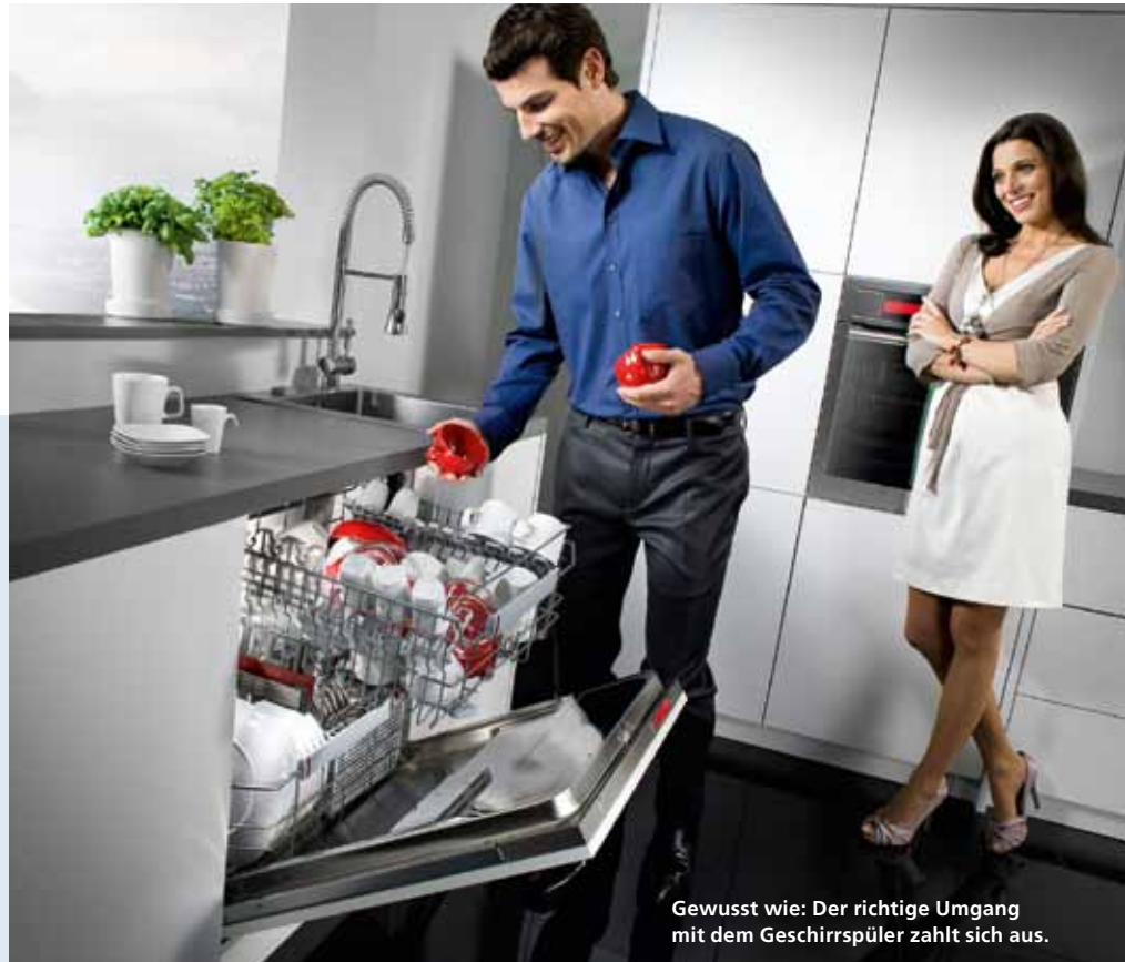
Gewusst wie: Der richtige Umgang mit dem Geschirrspüler zahlt sich aus.

das Gegenteil der Fall: Bei zu viel Spülmittel muss dieses eventuell noch einmal abgespült werden.