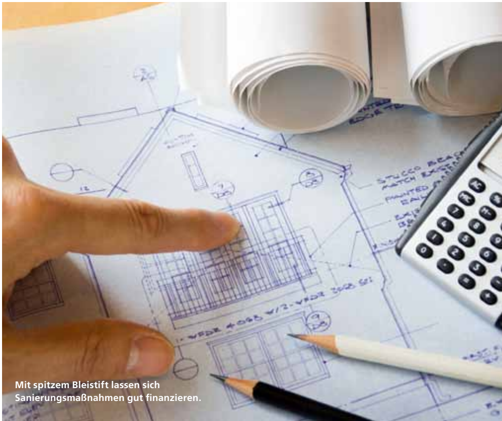
Mit spitzem Bleistift lassen sich Sanierungsmaßnahmen gut finanzieren.

Die neuen Förderprogramme der Kreditanstalt für Wiederaufbau (KfW) gelten seit dem 1. März 2011. Einzelmaßnahmen zur energetischen Sanierung werden finanziell unterstützt.