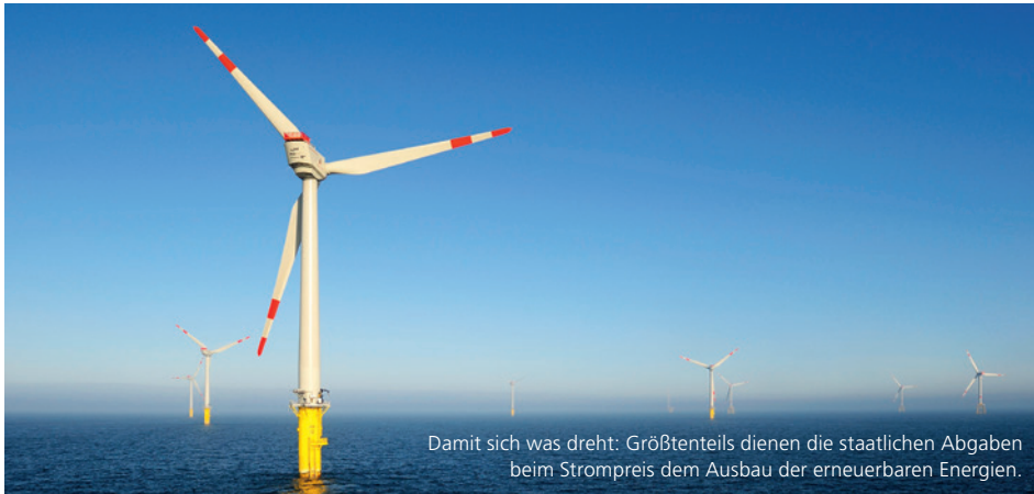
Damit sich was dreht: Größtenteils dienen die staatlichen Abgaben beim Strompreis dem Ausbau der erneuerbaren Energien.

Mit Beginn des neuen Jahres ändern sich die staatlichen Kostenbestandteile bei der Stromversorgung. Deshalb aktualisieren wir unsere Vertragsbedingungen – und gestalten sie noch einmal übersichtlicher.