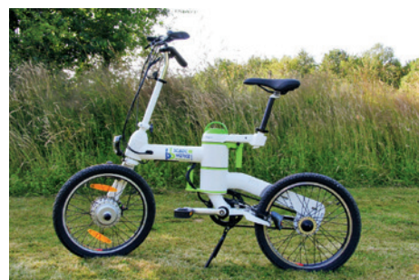
Ausleihen und los: Mit den Stadtwerke-Elektrofahrrädern macht der Ausflug ins Grüne nochmal so viel Spaß.