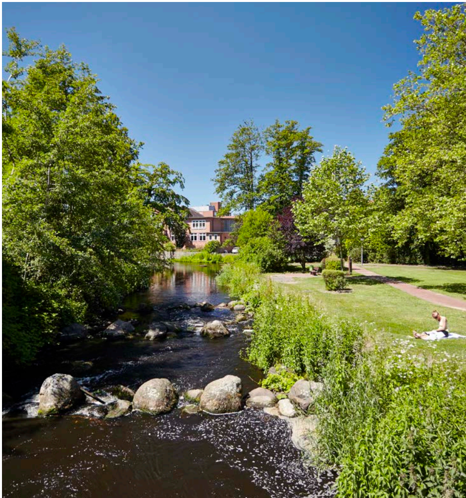
Dafür lohnt es sich: Das Umweltschutzengagement der Stadtwerke Bad Bramstedt zahlt sich direkt vor Ort aus.